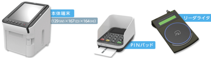
※ J-Mups端末は、JR東日本メカトロニクス株式会社の製品です。